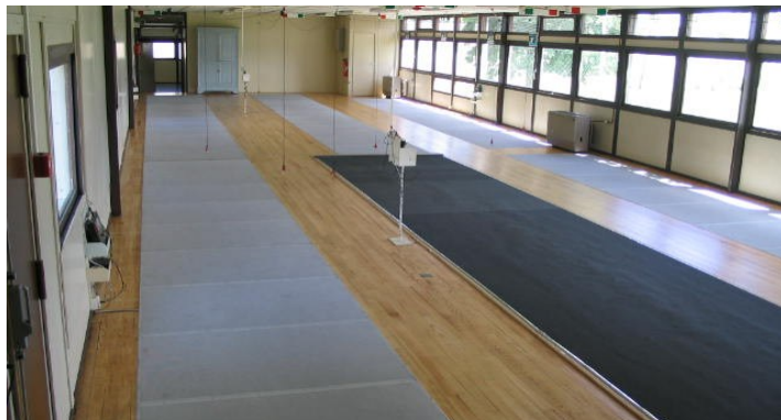
salle 6 pistes électriques fixes