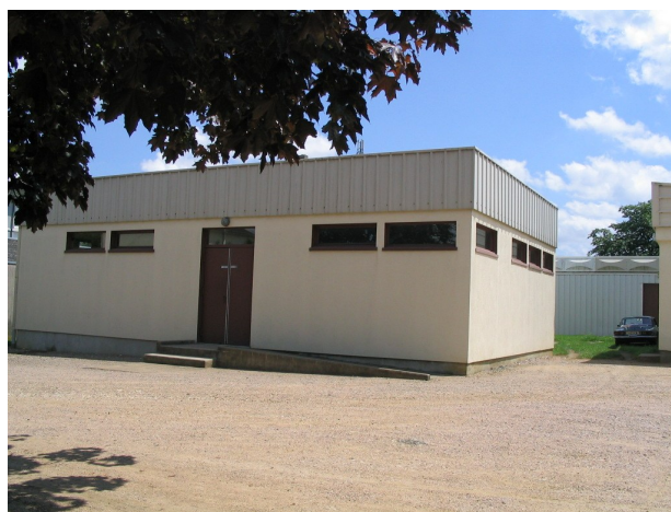
salle d'armes de Beaulieu