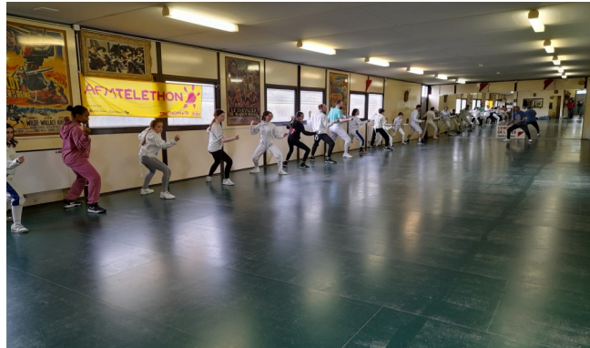
Echauffement salle d'entraînement