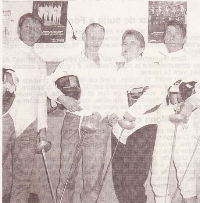
Les vétérans de la salle Lafoucrière ont participé aux championnats d'Europe à Moulins.

Engagés sur plusieurs fronts, les Montluçonnais du Club d'escrime de la salle Lafoucrière ont obtenu de bons résultats.