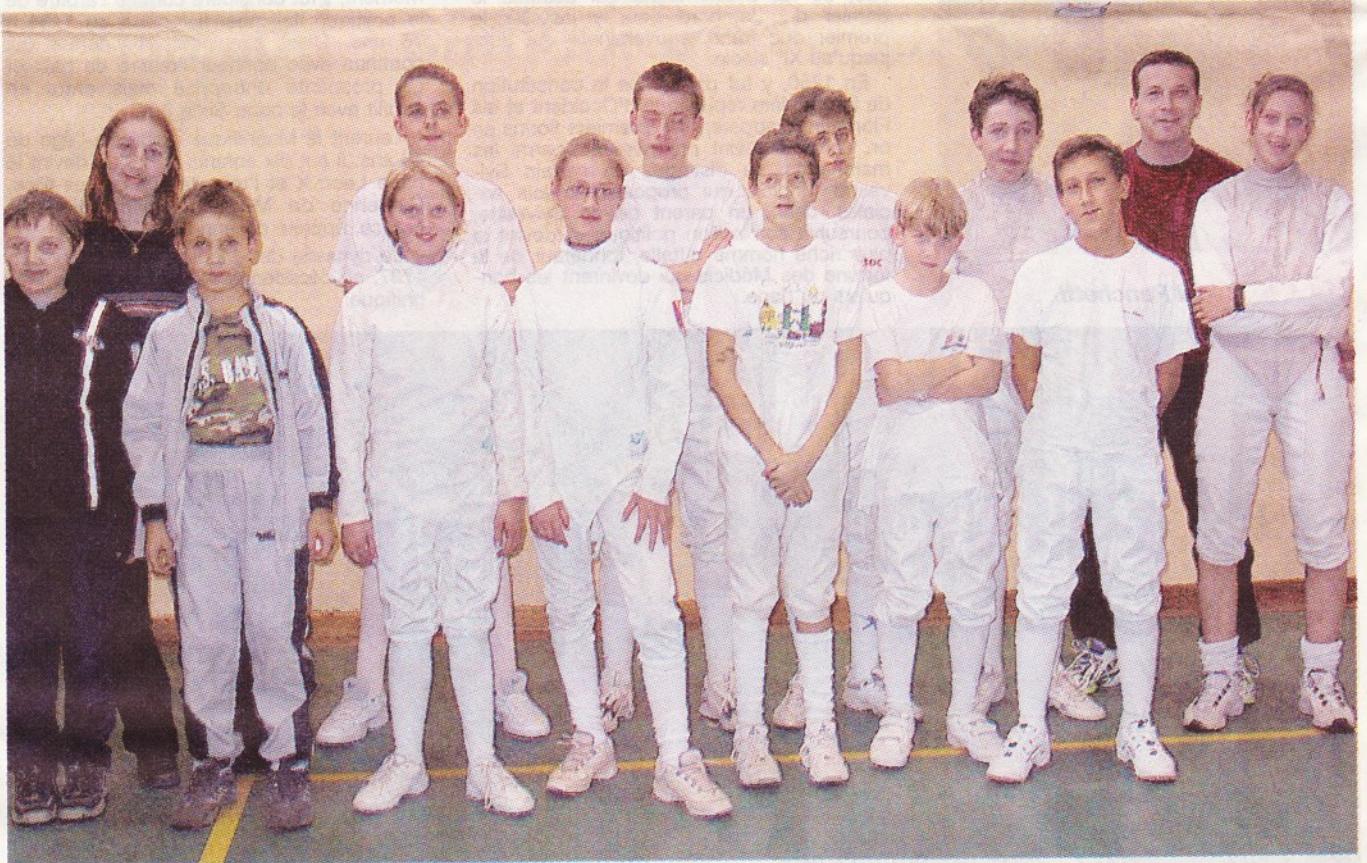
Ils ont été à la hauteur, les jeunes de la salle Lafoucrière.

Le tournoi de la ville de Montluçon a multiplié les assauts avec beaucoup de générosité. Entre les clubs de la Ligue d'Auvergne et les voisins de Brive, Limoges, Aubusson, Versailles et de la Haute-Corrèze, ce sont quelque 83 escrimeurs qui étaient sur les rangs d'une compétition de très bon niveau.