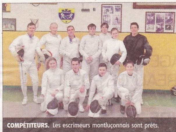
COMPÉTITEURS. Les escrimeurs montluçonnais sont prêts.

Les escrimeurs de la Salle Lafoucrière seront en compétition au cours des prochains week-ends.