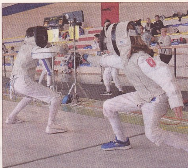
PRÉCISION. Suivant leur catégorie, les jeunes devaient toucher quatre ou cinq fois leur adversaire pour gagner leur rencontre.