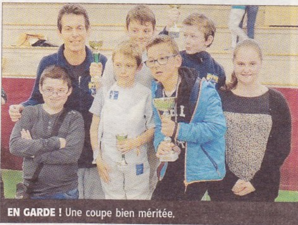
EN GARDE ! Une coupe bien méritée.

Les jeunes escrimeurs de la salle Lafoucrière ont participé au tournoi Alain-Lartigue, à Aubière, une compétition regroupant la quasi-totalité des clubs auvergnats.